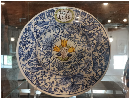
Habán tál

akik saját birtokaikon örömmel fogadták be őket. A habán orvosokat az előkelő hölgyek és urak előszeretettel alkalmazták, egyenesen divatosnak számítottak. A habán tető fogalomná vált annak tűzbiztos volta miatt, és több helyen kötelező alkalmazását is előírták. A habánok gyakorlatilag minden iparos munkában a legmagasabb színvonalon teljesítettek. Ám a legismertebb csúcstermékük a habán kerámia volt. Habán udvarok létesültek Felvidéken, Nyugat-Magyarországon, Sárospatakon és Erdélyben, Alvincen is. Erdélybe Bethlen Gábor erdélyi fejedelem telepítette a habánokat azért, hogy iparukkal felvirágoztassák a fejedelmi udvart és a térséget egyaránt.