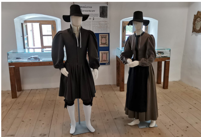
Habán viselet, foto: Hegedűs Ádám

Az anabaptista elveket hirdető prédikátorok az 1520-as években jelentek meg a Magyar Királyság területén. Feljegyzések szólnak arról, hogy Schröter Kristóf térítő munkát végzett Eperjesen, majd őt újabb anabaptista hittérítők követték felvidéki településeken. Ám az anabaptisták olyan egyházi szervezetet, mint a reformátusok vagy evangélikusok, nem alkottak, aminek oka részben a anabaptista gyülekezetek önállósága és önrendelkezése, másrészt pedig a Habsburgok által újra és újra megújuló üldözés és rekatolizáció. Kevés emlék maradt tehát utánuk. De az anabaptisták egy jól meghatározható csoportja, a habánok öröksége máig fennmaradt és számos helyen és módon tetten érhető az egykori Magyar Királyság területén.