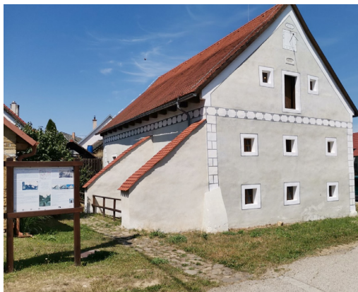
Habán ház, fotó: Hegedűs Ádám