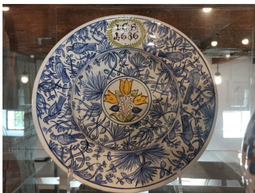
Habán tál

akik saját birtokaikon örömmel fogadták be őket. A habán orvosokat az előkelő hölgyek és urak előszeretettel alkalmazták, egyenesen divatosnak számítottak. A habán tető fogalommá vált annak tűzbiztos volta miatt, és több helyen kötelező alkalmazását is előírták. A habánok gyakorlatilag minden iparos munkában a legmagasabb színvonalon teljesítettek. Ám a legismertebb csúcstermékük a habán kerámia volt. Habán udvarok létesültek Felvidéken, Nyugat-Magyarországon, Sárospatakon és Erdélyben, Alvincen is. Erdélybe Bethlen Gábor erdélyi fejedelem telepítette a habánokat azért, hogy iparukkal felvirágoztassák a fejedelmi udvart és a térséget egyaránt.